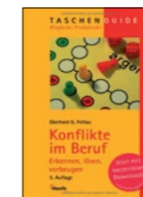
Eberhard G. Fehlau „Konflikte im Beruf: Erkennen. Lösen. Vorbeugen“ Taschenrechner, Verlag Haufe Lexware 2009. € 7,10